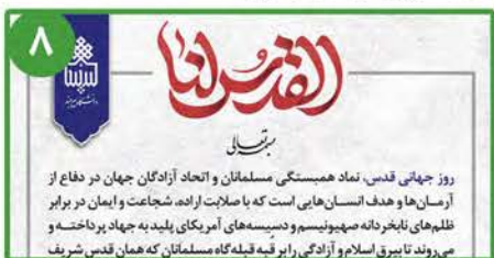
پیام رئیس دانشگاه بیرجند به مناسبت روز جهانی قدس