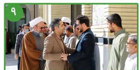
در جوار شهید گمنام دانشگاه انجام شد؛ مراسم دید و بازدید نوروزی دانشگاهیان دانشگاه بیرجند