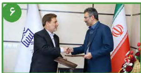
در راستای راه اندازی پردیس علم و فناوری دانشگاه بیرجند انجام شد؛ توافق همکاری دانشگاه بیرجند و پارک علم و فناوری خراسان جنوبی