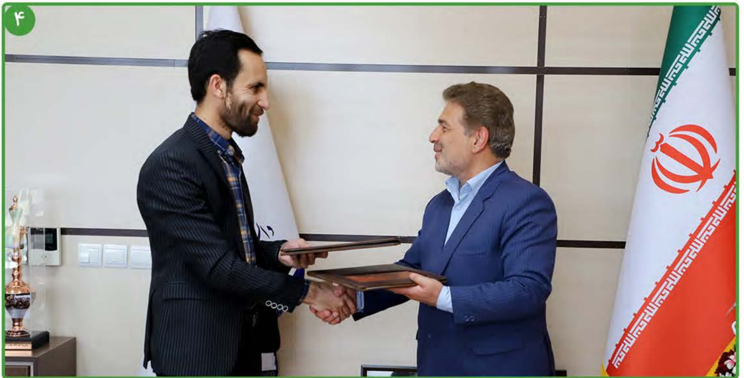
انعقاد تفاهم همکاری بین دانشگاه بیرجند و مؤسسه تحصیلات عالی هریوا کشور افغانستان

دانشگاه بیرجند؛ جامعه محور، مهارت آموز، کارآفرین